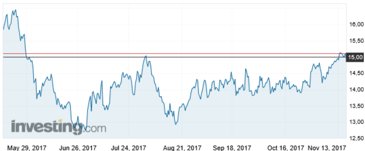
Wykres 4. Ceny cukru surowego w okresie 17 maj – 16 listopad 2017 r. (Kontrakty terminowe na cukier US nr 11, US cent/funt, cukier surowy)