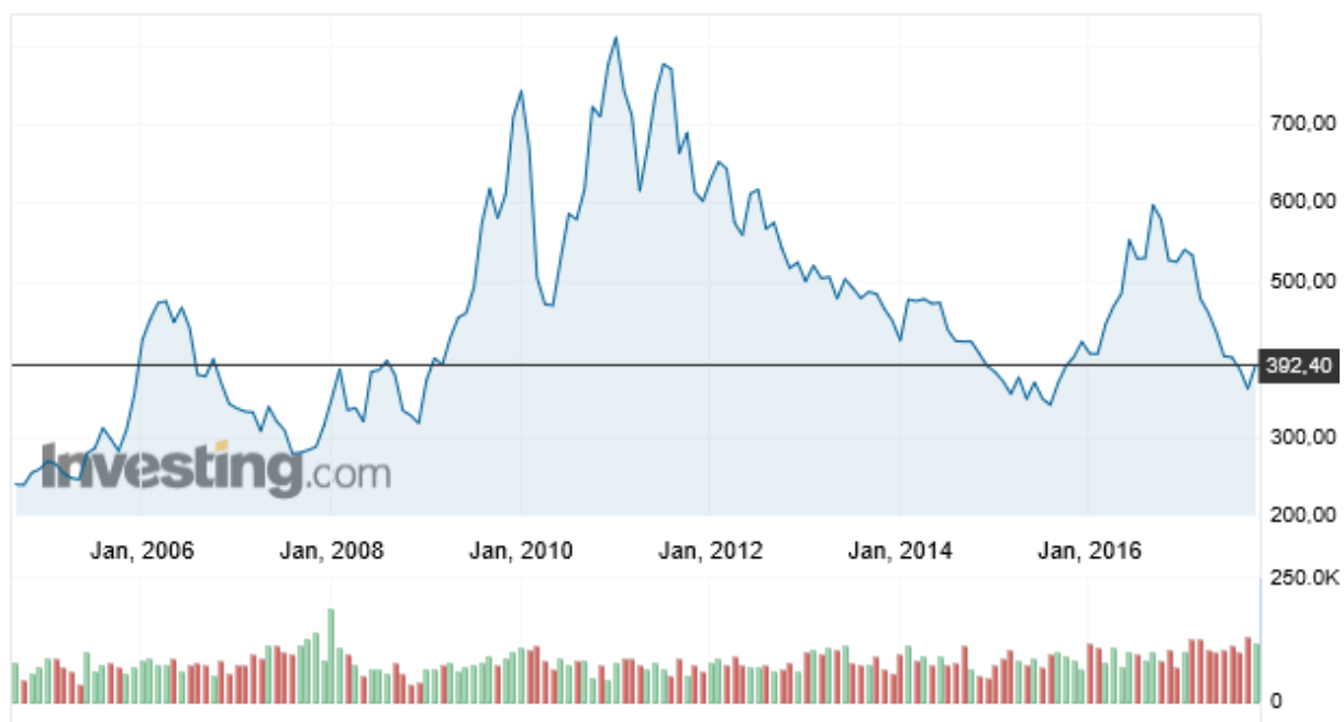
Wykres 3. Ceny cukru 2006 - 2017 r. (London Sugar No. 5, USD/t, cukier biały)