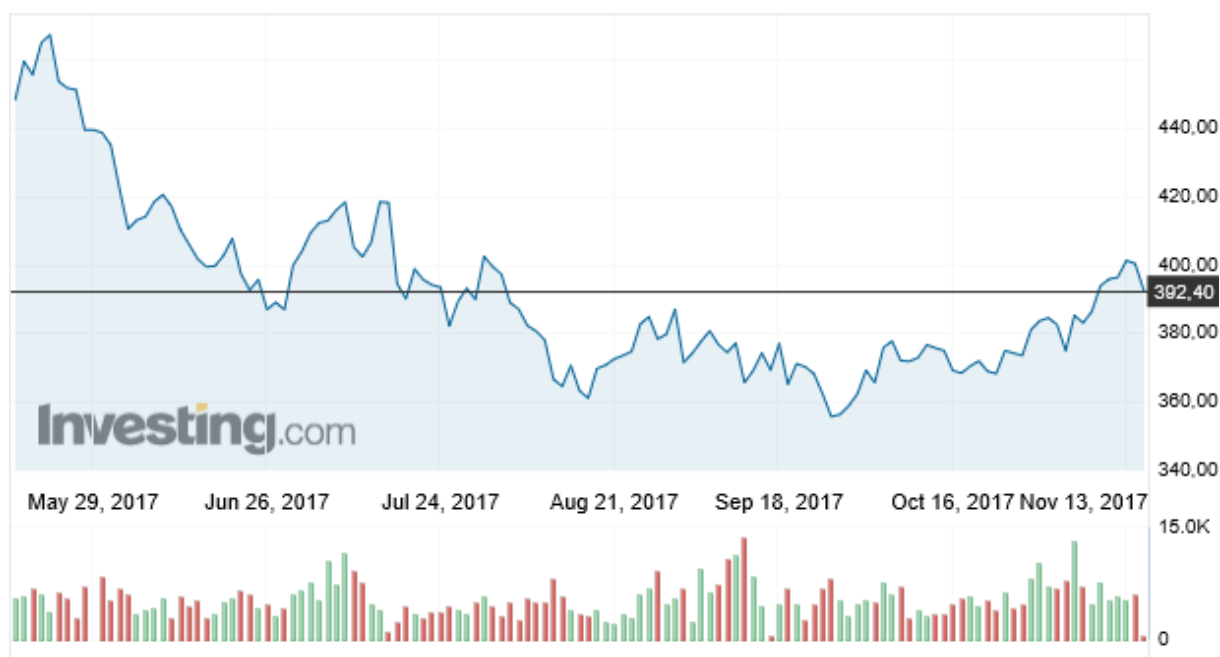
Wykres 2. Ceny cukru w okresie 16 maj – 15 listopad 2017 r. (Kontrakt terminowy, London Sugar No. 5, USD/t, cukier biały)